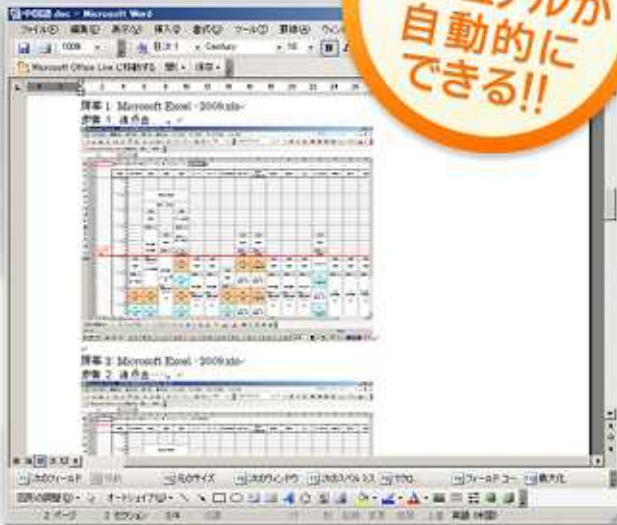
[中国語Wordジェネレート画面]