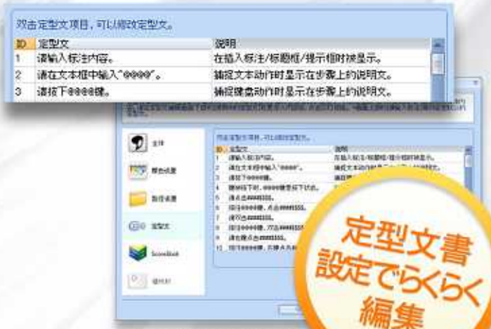
[中国語定型文書 設定画面]